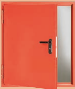
Feuerschutz-Klappe H8-5 für Öltank-Räume.